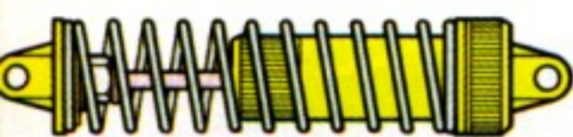
Amortisseurs longue course CVA (Réf. 5305)

Pour aller un peu plus loin, vous pourrez ensuite l'équiper de nombreuses options et accessoires "compétition"; par exemple: