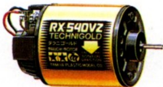
Moteur Technigold RX 540 VZ (Réf. 5290)