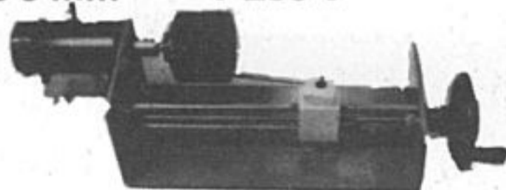
Appareil à tourner les pneus : 890 F