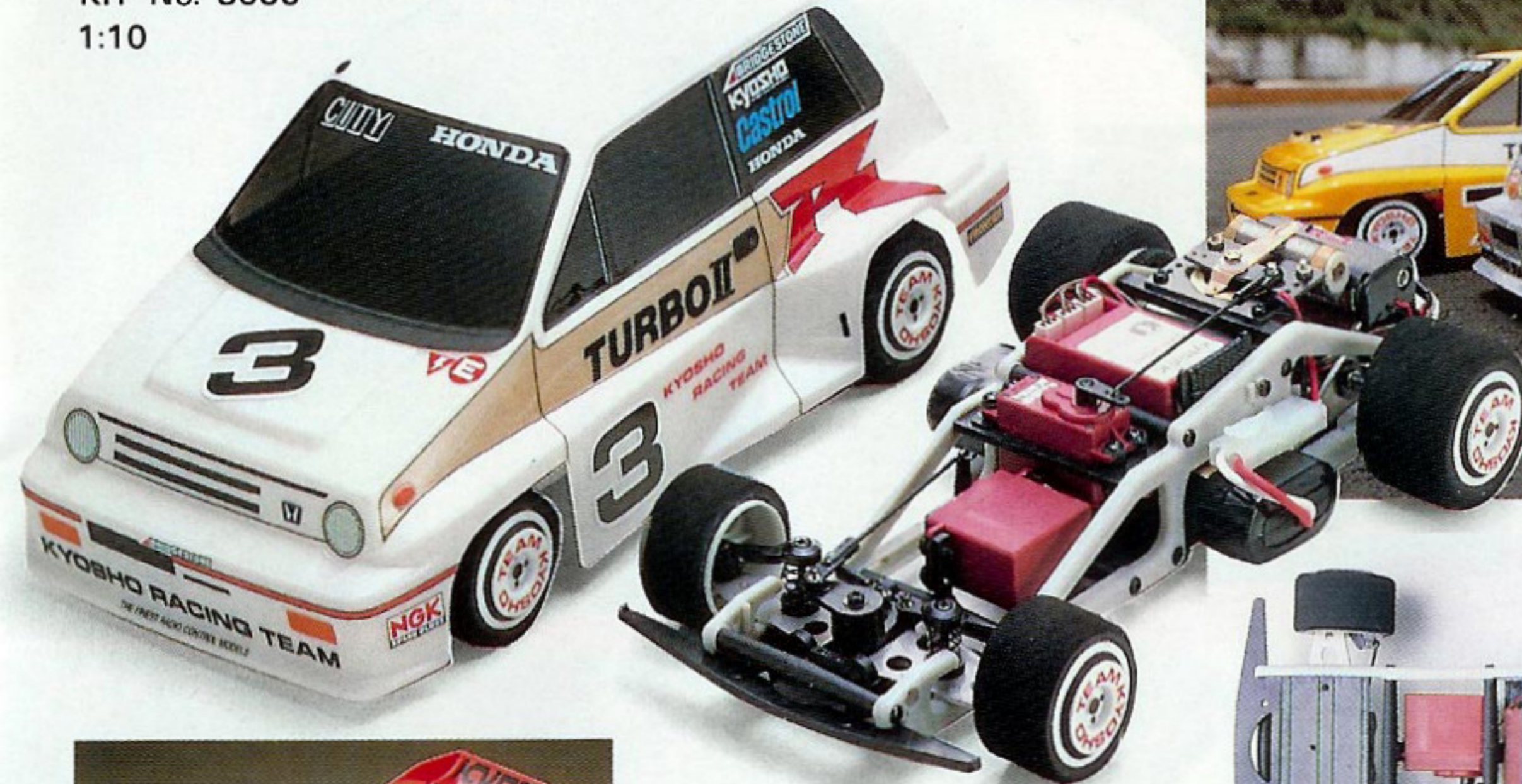
CITY TURBO IIR KIT No. 3055 1:10