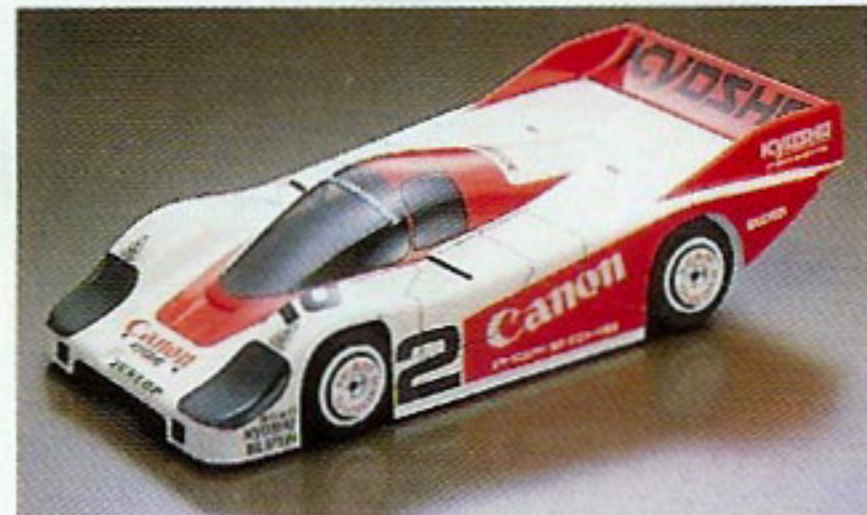
PORSCHE 956 KIT No. 3057 1:12