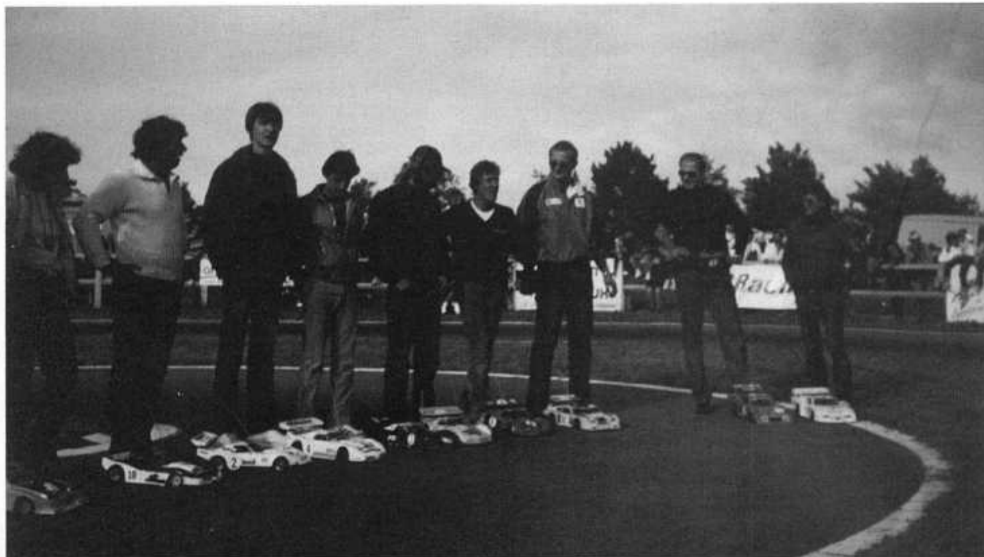
Les heureux finalistes.