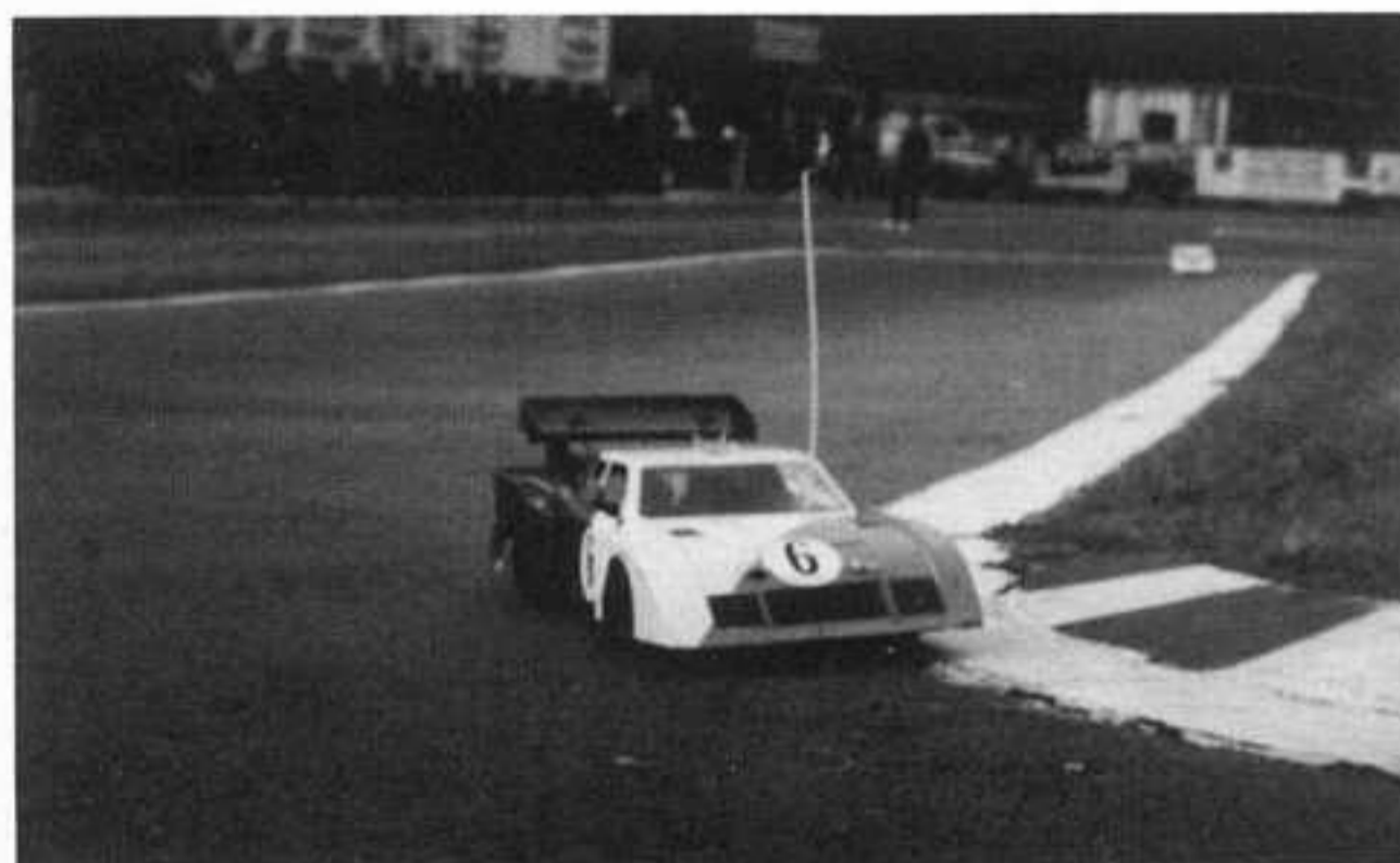
Une autre Corvette montée sur la S.G. de Bertrand.

remment il a toutes les chances de revenir sur les deux hommes de tête bien qu'il possède un tour de retard !