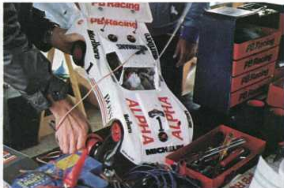
Un démarrage de D. Lecat.

journée. Au fil des heures, tout le monde allait essayer d'accrocher les 15 tours et à l'issue des manches de qualification, nous avons en finale directe :