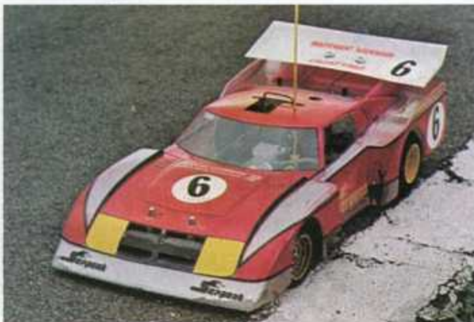
La Serpent de D. Gros.