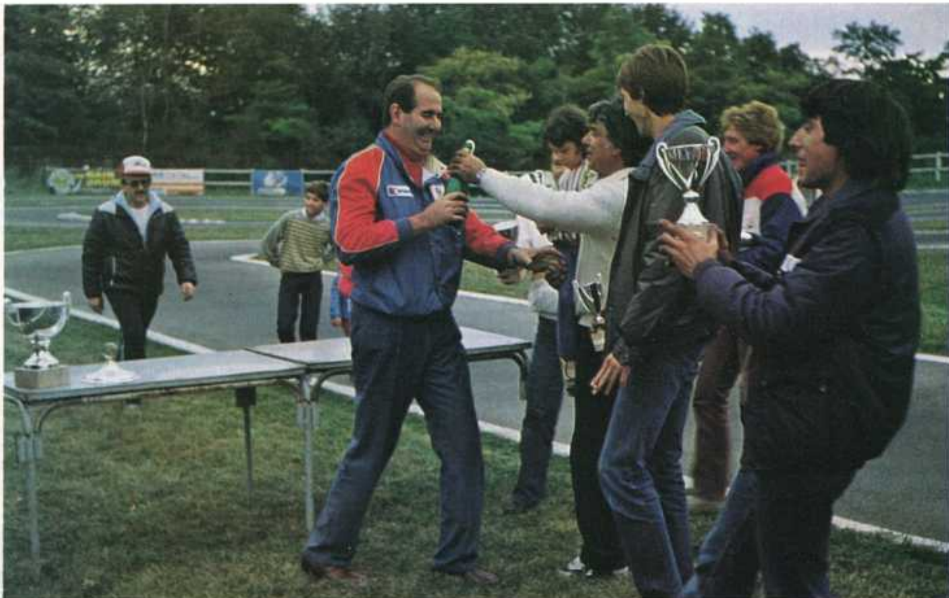
La remise des prix.