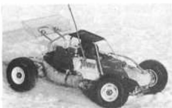
YANKEE Europa Racing 3750 F