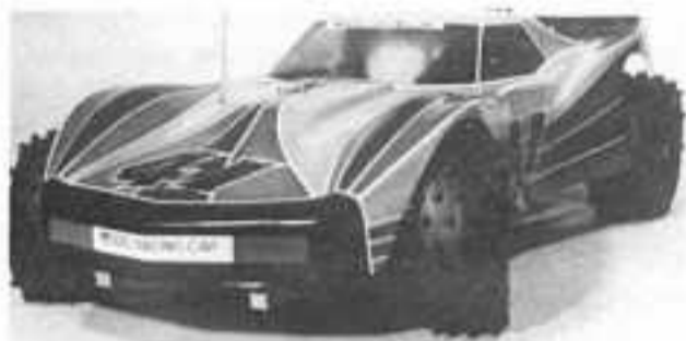
BUXY 4x4 1690 F