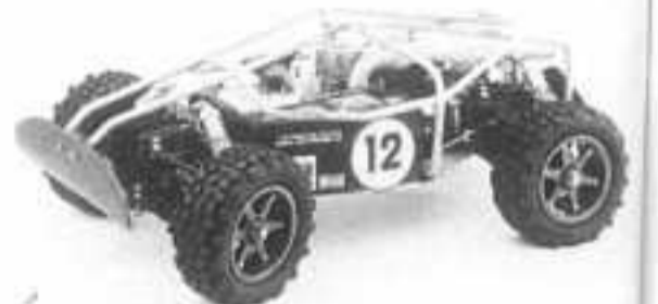
Guépard 4x4 - 3 diff 3200 F