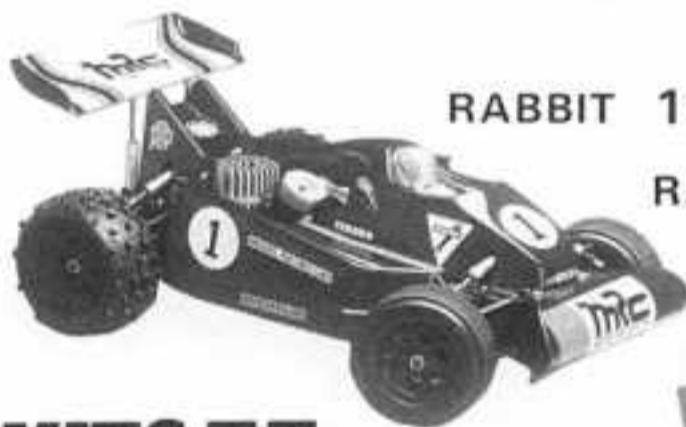
RABBIT 1050 F