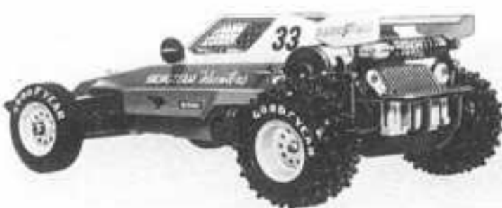
électrique, 40 km/h HUNTER 990 F