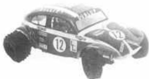
BULLIT 790 F