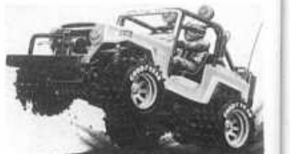
Super Wheelie électrique 760 F