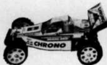
* Voir essai Auto RCM N° 86

Par correspondance PTT + 40 F. SERNAM + 80 F