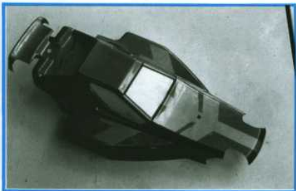
Après avoir retiré les caches de la décoration, la deuxième couleur (doré) a été appliquée. Une fois le tout bien sec, on peut retirer les caches des vitres.