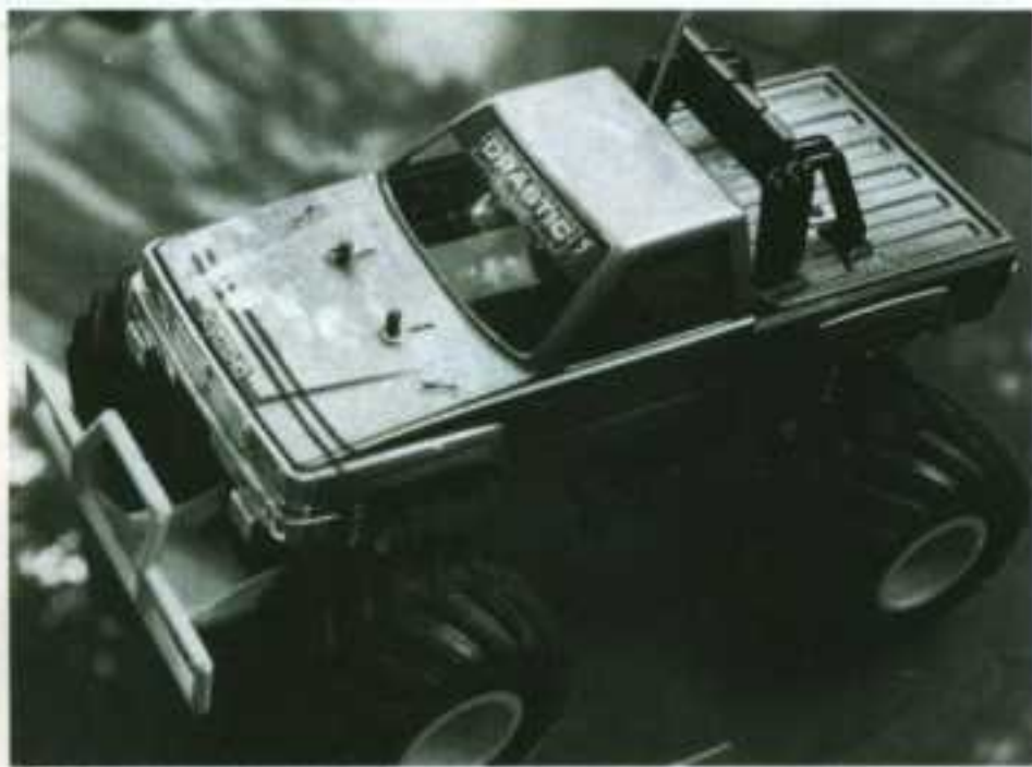
Une décoration sobre peut aussi être très réussie.