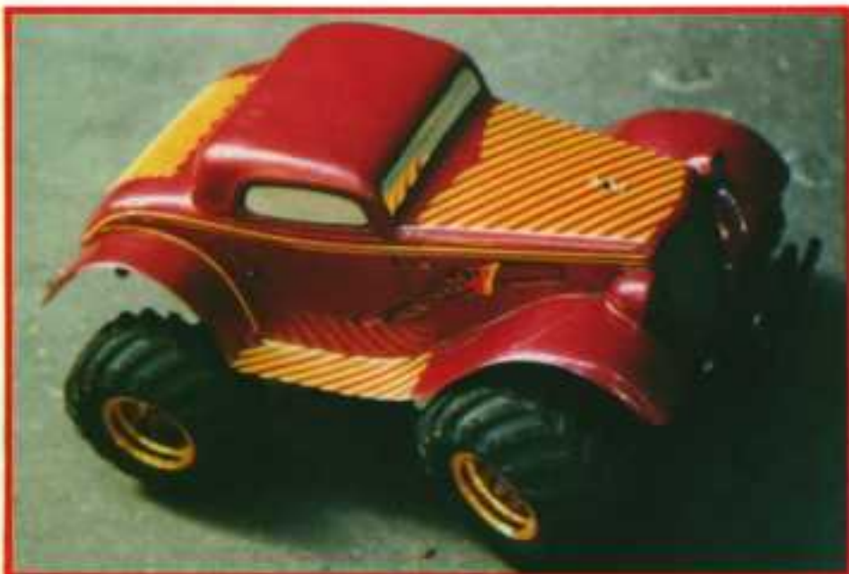
Avec des carrosseries telles que la Ford T, on peut s'amuser à faire des décorations plus folles !