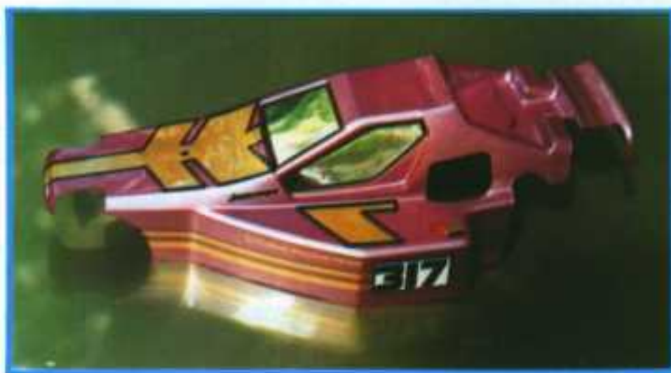
Pour terminer, nous avons appliqué des filets autocollants, ainsi que des décors fournis dans le kit. Pour un look encore plus «clean», nous avons collé du film d'aspect chromé sur les carreaux (toujours par l'intérieur) comme cela se fait sur les voitures grandeur nature.