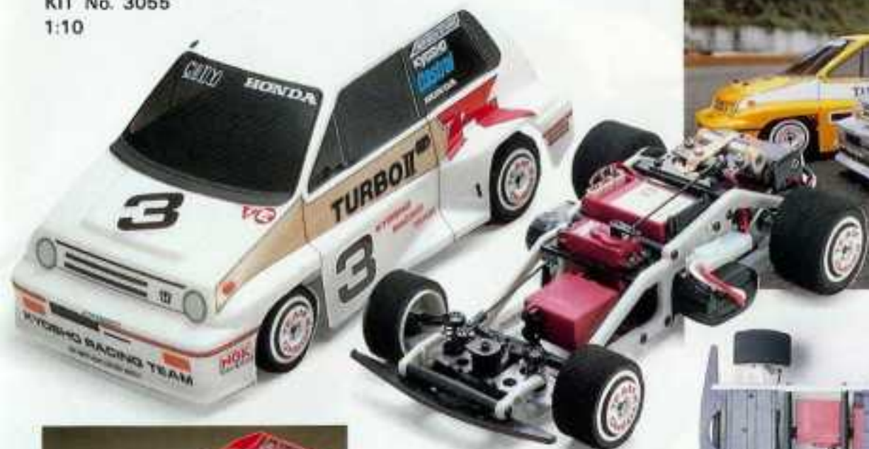
CITY TURBO IIR KIT No. 3055 1:10