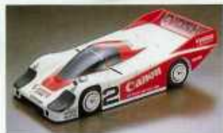
PORSCHE 956 KIT No. 3057 1:12