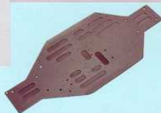
Chassis allégé anodisé noir / Lightened black anodized chassis