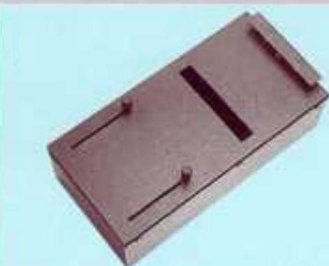
Boîte de démarrage / Starter box