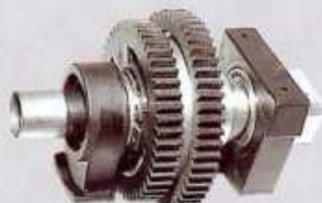
Différentiel central / Centre-mounted differential